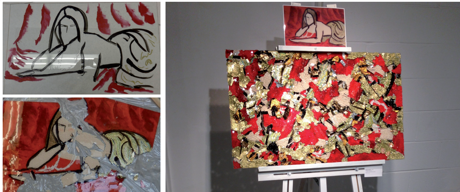
Reflection - acrylique sur verre trempé brisé (détail des étapes de réalisation)